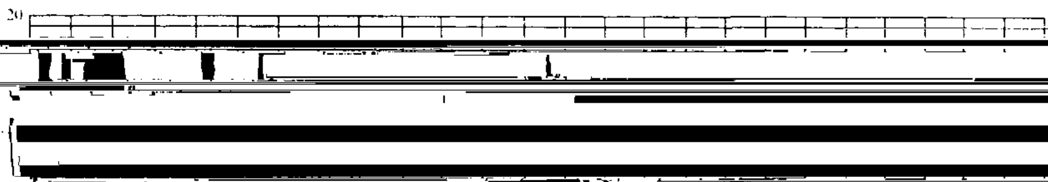
图2 n_s=20\sim 120 及 160\sim 290 自吸泵额定效率曲线

6.2.2 泵额定流量应满足下列要求：表2、表3中流量和转速相同（或相近）的泵的额定流量